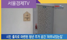
시민들이 만든 월 10만원 청년주택 (2018. 6. 1)