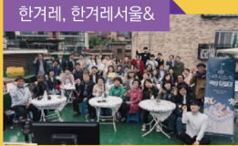
"터무니있는집 희망아지트" SH공사, 빈집활용 청년공간 조성(2020. 3. 20)