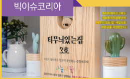
사회적경제로 해법찾아 스스로의 힘으로 자립한 청년들(2020. 3)

(머니S 2018. 5.11) 이웃의 도움으로 세운 청년 보금자리 '터무니있는집' 오픈 (한겨레 2018. 5.17) 시민 종착점으로 탄생한 청년들의 든든한 살터 (국민일보 2018. 5.18) 월세 8만원에 주거 걱정 끝 (한겨레 서울& 2018. 10. 18) 옥상서 깎두기도 함께 담고... (한겨레 서울& 2018. 10. 18) 시민 출자 세어하우스...박시장 "내가 찾던 모델" (한겨레 서울& 2018. 10. 18) 40~50대 주부·교사·회사원...100만~1천만원 출자 (한겨레 2018. 12. 12) '청년 니트, 개인 아닌 사회 문제'...힘내라는 말 대신 힘을 (매일경제 2019. 6.13) 서울시 "빈집이 청년주택으로" (한국일보 2019. 12.16) 나눔이 세상을 바꾼다 (연합뉴스 2019. 2.14) 빈집 재생'분궤도...'청년주택'시설' 연내... (뉴스토마토 2020. 5. 11) 시민자본으로 만드는 '터무니' 있는 청년주택